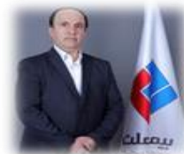
مسعود همتی مدیر بیمه‌های درمان